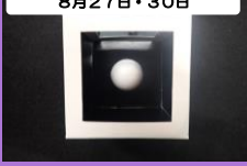
ふしぎな貯金箱 材料費:300円