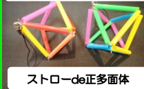
ストローde正多面体