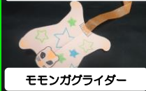
モモンガグライダー