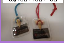
サメの紐ストラップをつくらう 材料費:400円