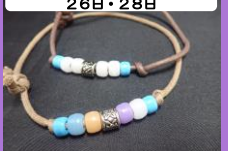
紫外線ってなんだろう 材料費:200円