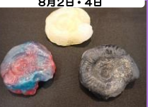
化石の正体 材料費:300円