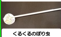
くるくるのぼり虫