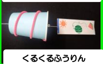
くるくるふうりん

①10:30～ ②13:00～ ③14:30～ 定員:各回40名 未就学児は保護者同伴