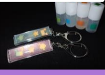
色水実験 材料費:200円