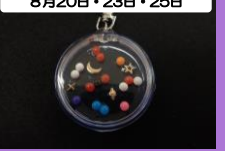
ビーズで分子模型 材料費:300円