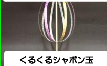
くるくるシャボン玉